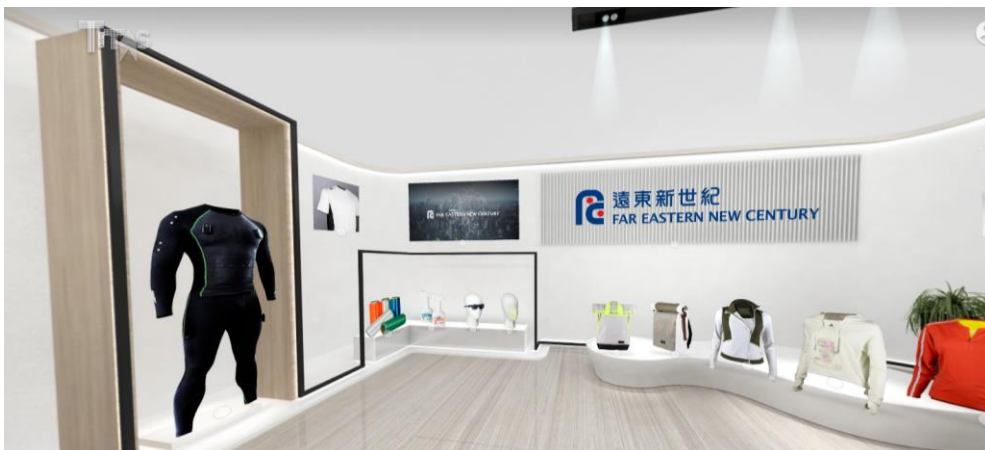
遠東新世紀展示間