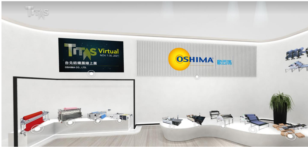
台灣歐西瑪展示間