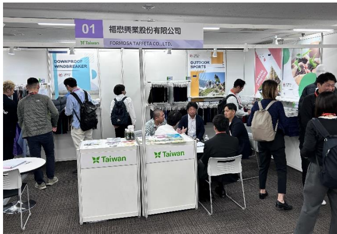
參展業者與買主熱絡商洽