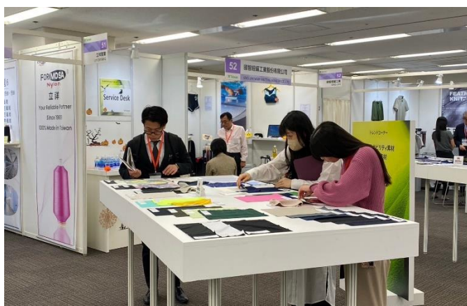
主題形象區精選業者機能性及永續環保主題的展品吸引買主駐足瀏覽