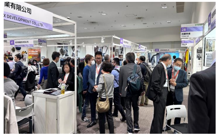
買主到場參觀踴躍