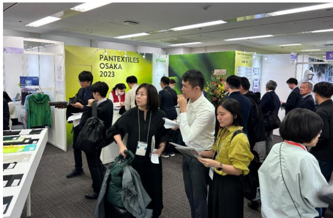
臺灣紡織品大阪展示會會場